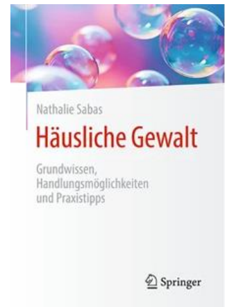
Sabas, N. (2024). Häusliche Gewalt: Grundwissen, Handlungsmöglichkeiten und Praxistipps . Cote IFEN : 362.76 SAB Häu