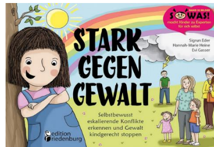
Heine, H.-M. u.a. (2019), Stark gegen Gewalt: selbstbewusst eskalierende Konflikte erkennen und Gewalt kindgerecht stoppen . Cote IFEN : 577 MAN Eco

F.use am Schlass - Centre de documentation pédagogique (CDP) - IFEN.