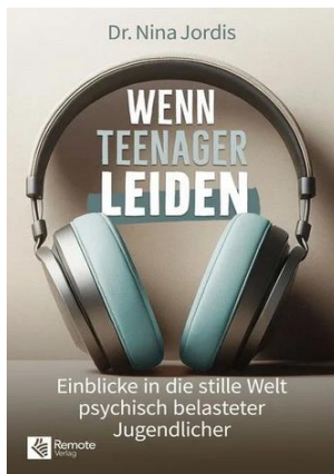
Jordis, N., (2024). Wenn Teenager leiden: Einblicke in die stille Welt psychisch belasteter Jugendlicher . Cote IFEN : 616.89 JOR Wen