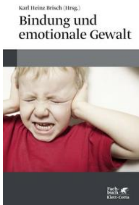
Brisch, K. (Hg.). (2018). Bindung und emotionale Gewalt . Cote IFEN : 362.76 BRI Bin