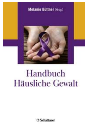
Büttner, M. (Hg.). (2022). Handbuch der häuslichen Gewalt . Cote IFEN : 362.76 BÜT Han